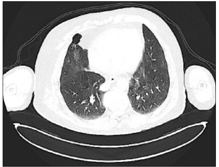
Figura 1. Tomografía de tórax: nódulo pulmonar paramediastínico en lóbulo inferior derecho (LID) de 18 mm.

Dada la ubicación de la lesión y ante la dificultad de acceso convencional se realiza ecografía endoscópica identificando una lesión pulmonar sólida, hipocogénica, espiculada, no vascularizada de 36x34mm a 37 cm de arcada dentaria superior que abomba e infiltra la pleura y la vena pulmonar derecha. No se objetiva infiltración esofágica. La punción aspiración con