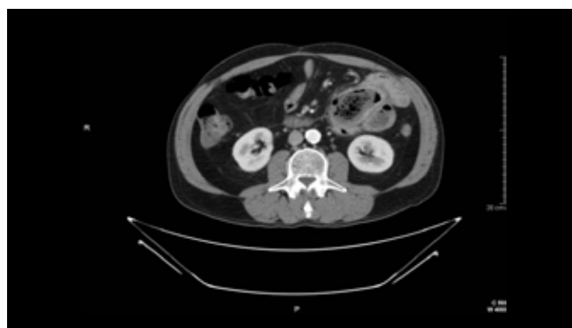
Figura 3 Fitobezoar de 90x40 mm en yeyuno con moderada dilatación retrógrada.

Tras la enteroscopia, con vistas a la cirugía, se realizó una enteroTAC abdominal para conocer con más exactitud el tamaño y las características del fitobezoar, mostrando una imagen intraluminal de 90x42mm (Figura 3), localizada en asa yeyunal