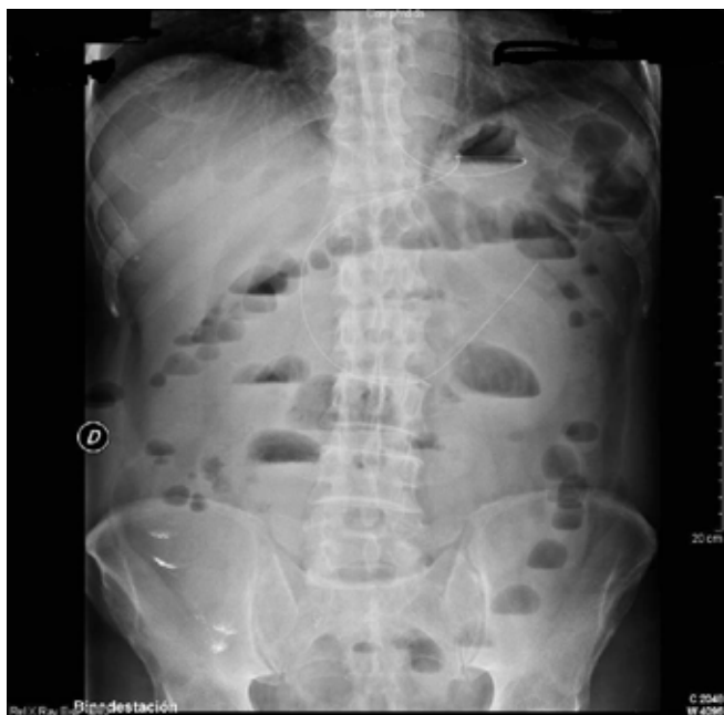
Figura 1 Numerosos niveles hidroaéreos de Intestino Delgado.

de colon sin signos obstructivos, y una imagen de posible bezoar intestinal. Se repitió la endoscopia oral, con resultado superponible al previo. Tras una semana de manejo conservador y ausencia de mejoría del cuadro, se decide repetir la TAC abdominal, que no mostró imagen de obstrucción intestinal, con desaparición del bezoar y describiendo una hernia de Spiegel, con pequeña cantidad de líquido libre. Finalmente tras 15 días de manejo conservador infructuoso, se decide realizar una laparotomía media exploradora, en la que se objetiva un síndrome adherencial muy marcado, y una hernia de Spiegel, realizándole adhesiolisis y herniorrafia derecha, cursando el postoperatorio sin incidencias, siendo dado de alta para su seguimiento en consulta.