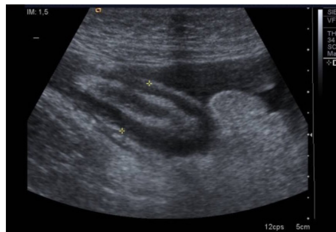
Figura 4 Corte longitudinal por ecografía abdominal donde apreciamos el aumento de tamaño del apéndice cecal.